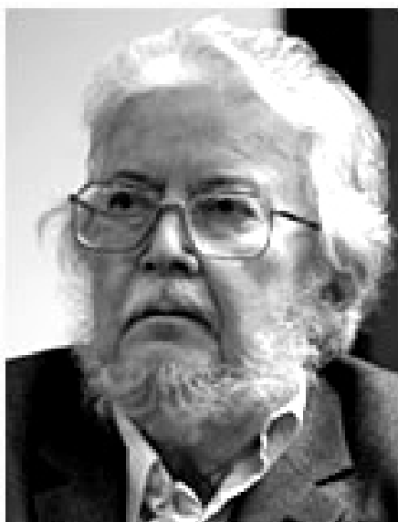
Fernando del Paso