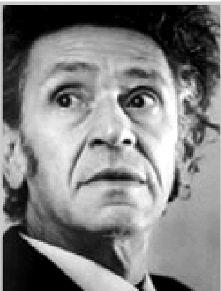
Juan José Arreola